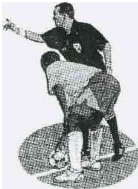
УДАР МЯЧА С БОКОВОЙ