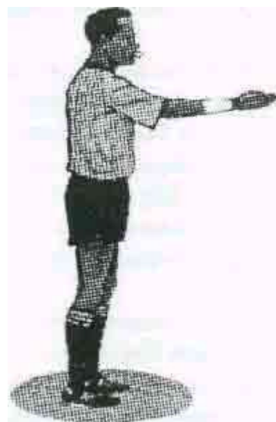
НАЧАЛО И ВОЗБНОВЛЕНИЕ ИГРЫ