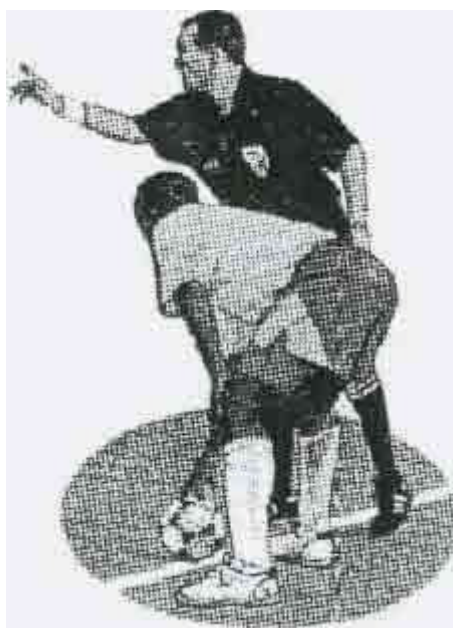
УДАР МЯЧА С БОКОВОЙ