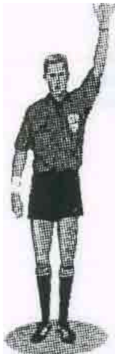
ПЯТЫЙ НАБРАННЫЙ ФОЛ