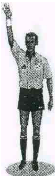
ОТСЧЁТ ЧЕТЫРЁХ СЕКУНД