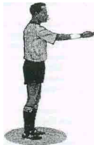
НАЧАЛО И ВОЗБНОВЛЕНИЕ ИГРЫ